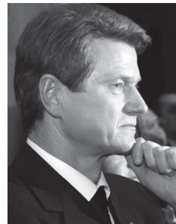
Pirmininkas Rolandas Paksas