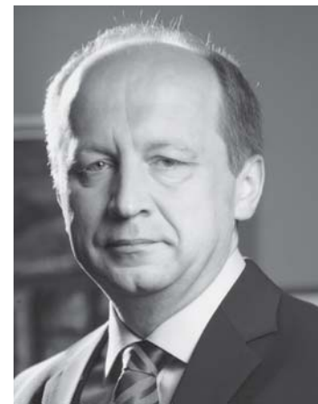
Pirmininkas Andrius Kubilius