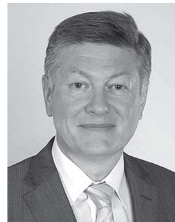
Pirmininkas Artūras Paulauskas