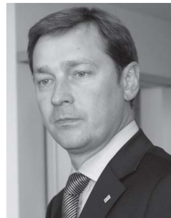
Pirmininkas Artūras Zuokas