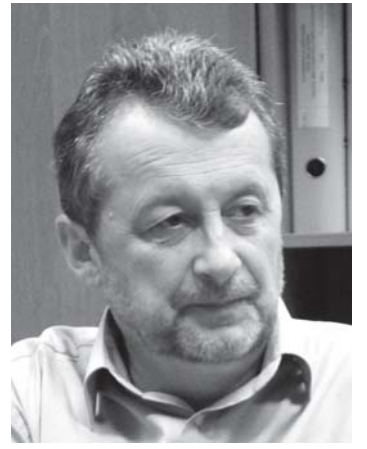
Pirmininkas Arūnas Grumadas